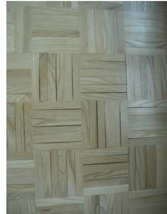
Bild von Boden mit Fuge