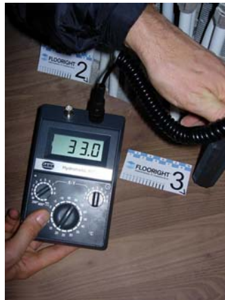
Messung der Parkettoberfläche