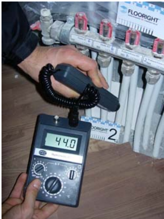
Messung der Vorlauftemperatur

Zu hohe Temperaturen können zu unterschiedlichen Beanstandungen (z.B. Fugenbilder) führen.