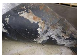
Bild 2 zeigt das Schadensbild beim hochheben der PVC-Bodenbelag-elemente. Die Zerstörung der nicht wasserfesten Verlegewerkstoffsysteme sind erkennbar

Das Bild 1 zeigt die Linoleum-Bodenbelagsschäden aufgrund der ungenügenden Haftung/Verkrallung der Spachtelmassenschicht