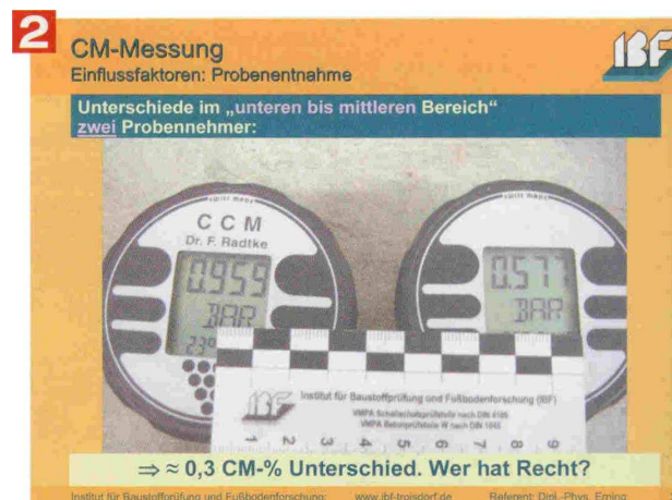
Bild 1: Bei verändertem Schüttelverhalten ergaben sich deutliche Unterschiede