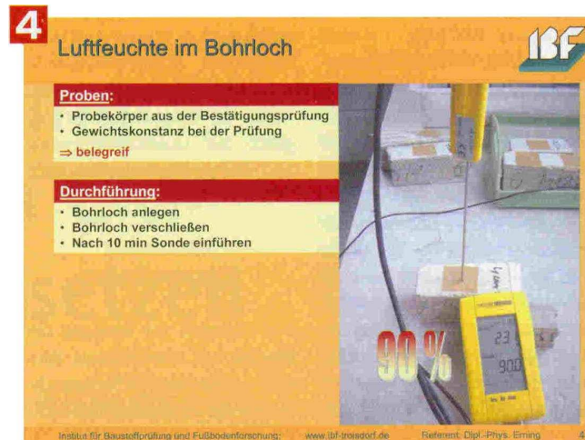
Bild 4: Alternative Messmethode der Luftfeuchtemessung im Bohrloch