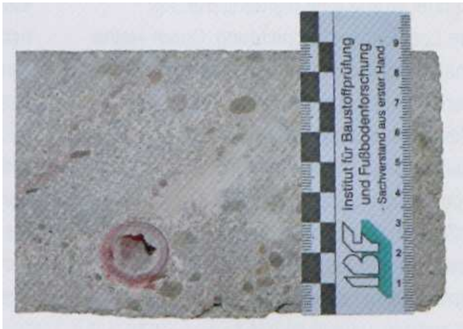
Bild 2: Querschnitt eines Heizestrichs Bauart A; Heizrohr mit ca. 10 mm Abstand zur Dämmschicht verlegt

Nach dem Normtext würde die Estrichnenndicke dann für obiges Beispiel ebenfalls 80 mm betragen. Da das Heizrohr aber mit einem Abstand von 10 mm von der Dämmschicht verlegt ist, würde sich hieraus eine um dieses Maß reduzierte Rohrüberdeckung ergeben. Da die Rohrüberdeckung aber maßgebend für die Tragfähigkeit des Estrichs ist, hätte dies eine reduzierte Tragfähigkeit des Estrichs zur Folge.