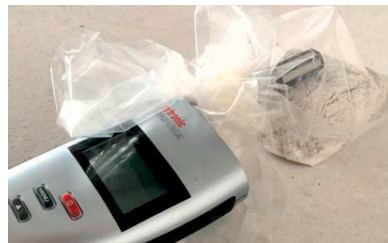
Grafik 3: Der Sensor des Messgerätes wird mit Staub befrachtet.

Messdauer häufig nach oben abdriftende Messwerte zeigen, wenn das Messband selbst Feuchtigkeit aufnimmt. Mit teils über 10 % ist die Messwertdrift keinesfalls tolerierbar. Dass auch Messtechnik verfügbar ist, die solche Messwertabweichungen nicht zeigt, hilft in der Baupraxis nicht weiter. Es kann nicht erwartet werden, dass vom Handwerker für KRL-Messungen auf der Baustelle Labormessgeräte zu horrenden Preisen gekauft werden.