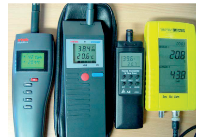
Grafik 2: Die Messtoleranz hochwertiger Hygrometer wird üblicherweise mit +/- 1 bis 2 % angegeben. Baustellen-übliche Geräte liegen bei +/- 2 bis 3 %. Leider ist auch nach ausreichender Klimatisierung im Labor bei verschiedenen Messgeräten mit unterschiedlichen Ergebnissen zu rechnen.

Die Mobilität des Wassers wird bestimmt von den Eigenschaften des jeweiligen Baustoffs, insbesondere von der Porosität (Porenvolumen, Art, Grösse und Verteilung der Poren). Grundsätzlich kann davon ausgegangen werden, dass grobporige Baustoffe mit ausgeprägter Kapillarität (z. B. Holz) sehr viel schneller und sehr viel stärker trocknen, als zementäre Baustoffe. Zementstein weist eine sehr komplexe und extrem feinporige Struktur mit sehr engen Kapillarporen sowie geschlossenen und anderen, nicht trocknungsaktiven Nano- und Mesoporen auf