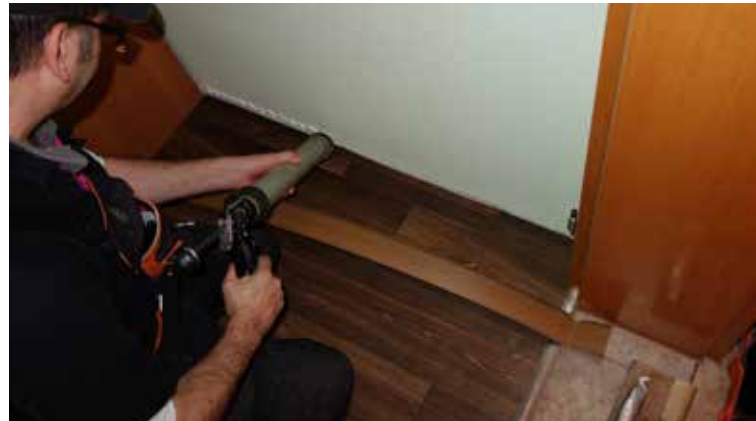
Application d'une colle de montage sans solvant

Lors de la pose de plinthes de serrage, il est nécessaire d'espacer les chevilles d'environ 20 à 40 cm. Dans les bâtiments soumis à d'importantes variations climatiques, les bandes de revêtement en linoléum doivent être collées dans les plinthes avec une colle de contact. Si ces bandes de revêtement sont collées sur les plinthes uniquement avec une bande adhésive, les tensions dans le revêtement dues aux variations de la température et du taux d'humidité entraîneront le décollement du revêtement.