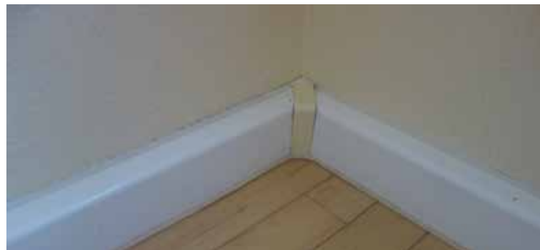
Plinthe installée dans les règles de l'art pour les conduits de chauffage dans une zone d'angle

Pour éviter les joints dans les plinthes en moquette remaillée, celles-ci doivent être posées sans tension ni étirement excessif et frottées de nouveau seulement après la pose. Pour les revêtements en velours, le marouflage doit toujours être effectué dans le sens du poil.