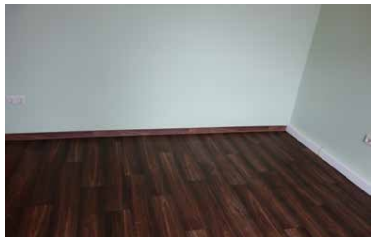
Plinthe installée, assortie au nouveau revêtement CV