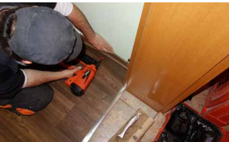
Agrafage de la plinthe

La presse spécialisée a publié en février 2007 un article sur le problème de l'humidité des murs, qui traite de l'aspect juridique d'un sinistre et devrait inciter les poseurs à bien réfléchir. Des plinthes enrobées de plastique ont été posées sur un support d'enduit minéral qui n'était manifestement pas assez sec. Les plinthes se sont déformées et décollées. La cour d'appel de Cologne a ordonné au preneur d'ordre chargé des travaux de revêtement de sol d'éliminer les défauts, bien que celui-ci ait objecté, en se référant à la norme DIN 18365, qu'il devait contrôler uniquement l'humidité résiduelle du sol et non celle des murs. La cour d'appel de Cologne justifie son arrêt du 8 février 2006 – 11 U 93/04 comme suit: «Le preneur d'ordre est responsable du fait qu'il n'a pas respecté ses obligations de contrôle et d'information figurant au § 4 n° 3 VOB/B. Il est vrai que la norme DIN 18365 ne prévoit pas expressément, au paragraphe 3.1.1, d'obligation de contrôle des surfaces murales. L'étendue de l'obligation de contrôle n'est cependant pas décrite de manière exhaustive par la norme DIN, mais cite simplement un exemple. L'entrepreneur est tenu de contrôler tous les facteurs qui peuvent avoir une influence directe sur la qualité de la prestation.»