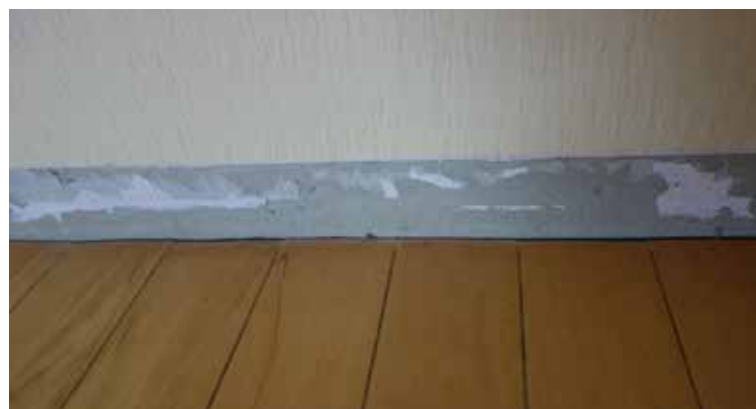
Le support d'enduit pour la pose des plinthes doit être préparé dans les règles de l'art

En général, les dommages sur des plinthes sont plutôt rares. Mais en cas d'endommagement de plinthes, il convient de réparer celui-ci, au prix d'efforts parfois importants. Il faut souvent remplacer les plinthes, déplacer les meubles voire même retoucher l'enduit mural dans les zones concernées. De telles réclamations sont particulièrement agaçantes lorsque, par exemple, la cause de l'humidité dans les murs ne peut pas être déterminée. Cela a déjà donné lieu à de nombreux litiges, notamment dans le cas de bâtiments neufs.