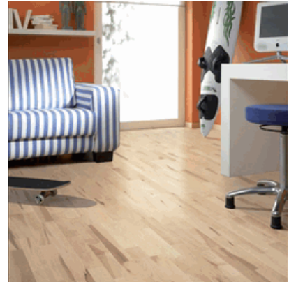
Ahorn (kan.) Bravo