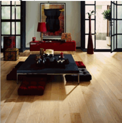
Ahorn kanad. Vancouver