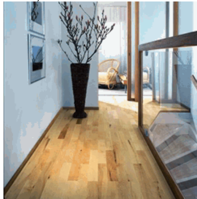
Ahorn kanad. Glasgow 1 HPS 019