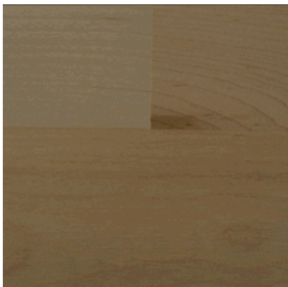
Ahorn canadisch Trend, matt versiegelt, 2-Stab, 2-Schicht