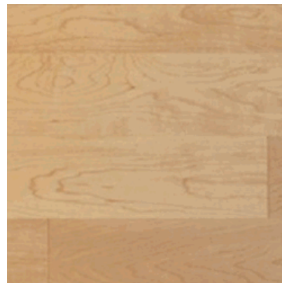
2-Schicht Ahorn kanadisch Select versiegelt