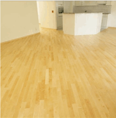
Ahorn kanadisch natur, Werksgeölt, 1-Stab