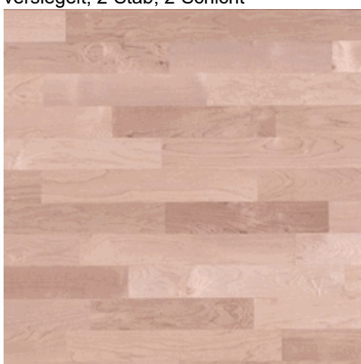
Ahorn (kan.) Nature