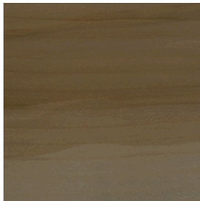
2-Schicht Ahorn kanadisch, struktur, Classic versiegelt